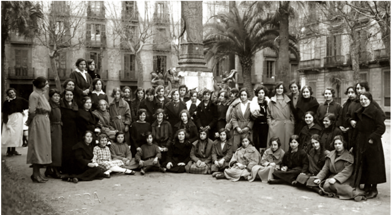
Grup de joves alumnes a la plaça del Duc de Medinaceli de Barcelona.