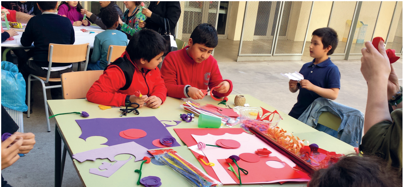
Centre Obert Eixample, Taller festa de Sant Jordi.