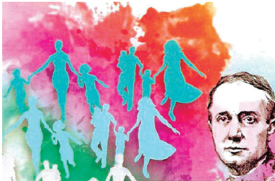
Mural amb el rostre de Sant Pere Poveda.

La Institució Teresiana és una Associació Internacional de laics,