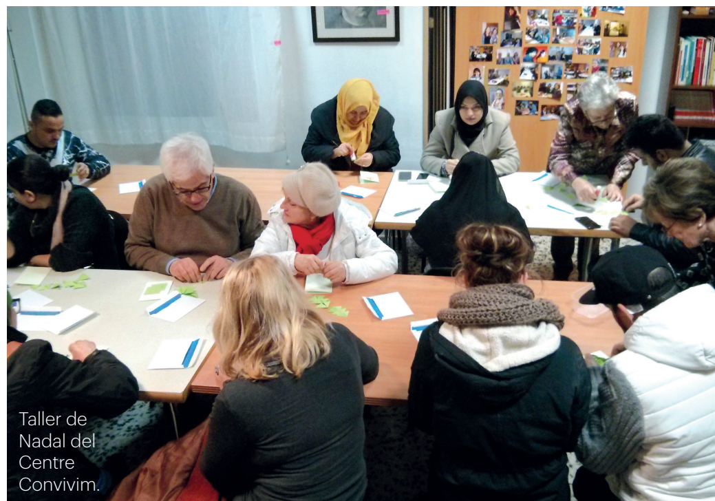
Taller de Nadal del Centre Convivim.

Les seves motivacions es barregen amb les seves necessitats concretes, com aprendre les llengües del país